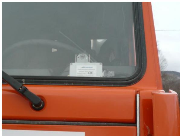
Рис 3 Рекомендованное место установки

Прибор «ТПМ» необходимо размещать внутри автотранспортного средства таким образом, чтобы обеспечить максимальный обзор на небесную сферу со стороны крышки прибора. Один из наиболее оптимальных вариантов – закрепление блока на лобовом стекле на двусторонний скотч, либо расположение на передней панели за лобовым стеклом автотранспортного средства. Крышка прибора – более тонкая половина корпуса, на которой расположен светодиод.