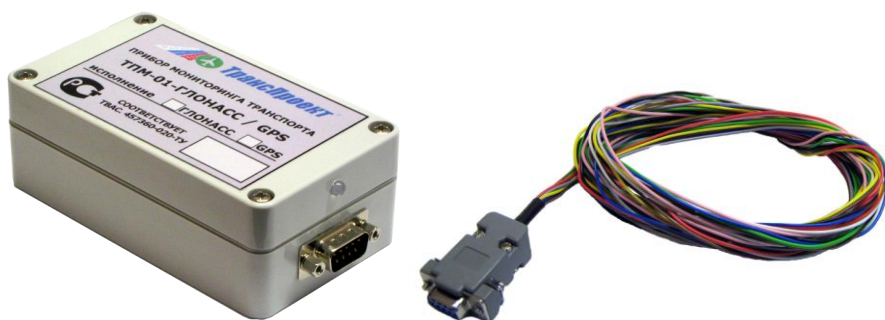
Рис 1. Внешний вид блока мониторинга